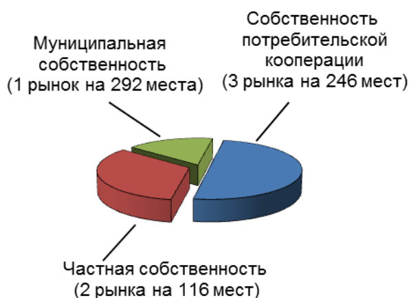
Распределение числа рынков по форме собственности